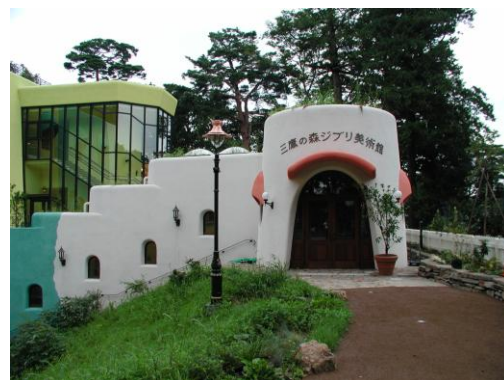
三鷹市立アニメーション美術館 (三鷹の森ジブリ美術館)

市制施行 昭和25年11月3日 市の人口 179,887人（平成23年12月1日現在 外国人登録者数含む。） 市の面積 16.50km 2 姉妹都市 福島県西白河郡矢吹町、兵庫県たつの市 市の木 いちょう 市の花 はなかいどう