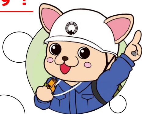
三鷹市防災キャラクター じょまる